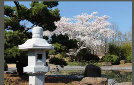
Park Schloss Dyck, Asia Schaugarten Jüchen Stiftung Schloss Dyck/ Anja Spanjer (2022)