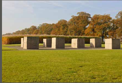
Park Schloss Dyck, Zehn Variationen eines Blocks (Ulrich Rückriem) Jüchen Stiftung Schloss Dyck (2011)