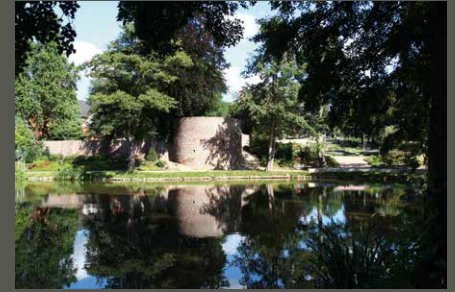
Gartenpark Wassenberg, Wassenberg Wolfgang Rembierz (2012)