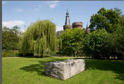
Park Schloss Moyland, Römisches Steinbuch (Kubach-Wilmsen) Bedburg-Hau Stiftung Museum Schloss Moyland (2012)