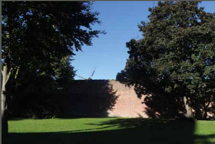
Friedestrompark Zons, Dormagen Rhein-Kreis Neuss (2021)