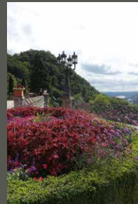
Park Schloss Drachenburg, Königswinter Pohl + Grüßen (2023)