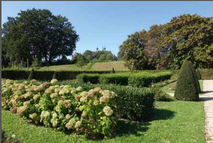
Klostergarten Kamp, Kamp-Lintfort Pohl + Grüßen (2023)