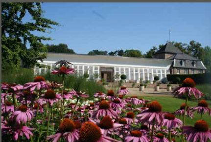
Park Schloss Dyck, Orangerie Jüchen Stiftung Schloss Dyck/ Anja Spanjer (2012)