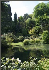
Adolf- Vorwerk-Park, Wuppertal Pohl + Grüßen (2013)