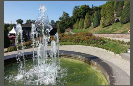
Klostergarten Kamp, Kamp-Lintfort Pohl + Grüßen (2023)