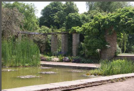
Nordpark Düsseldorf, Düsseldorf Pohl + Grüßen (2011)