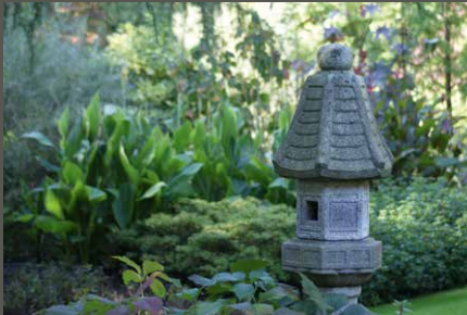
Carl Duisberg Park / Japanischer Garten, Leverkusen Pohl + Grüßen (2010)