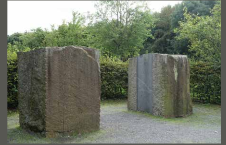
Künstlergarten Ulrich Rückriem, Rommerskirchen Pohl + Grüßen (2023)