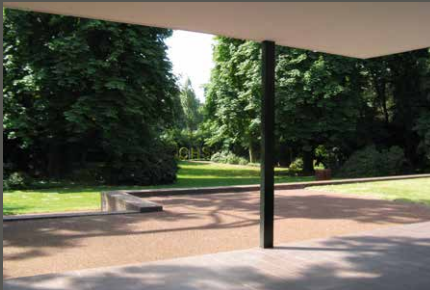
Haus Esters / Haus Lange, Krefeld Almuth Spelberg (2006)