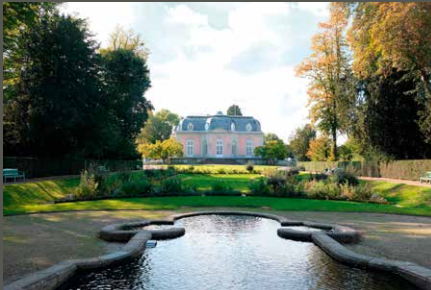
Park Schloss Benrath, Düsseldorf Stiftung Schloss und Park Benrath (2022)