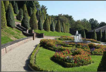
Klostergarten Kamp, Kamp-Lintfort Pohl + Grüßen (2023)