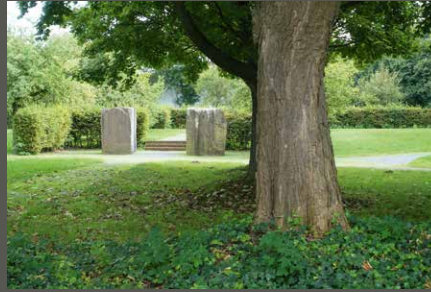
Künstlergarten Ulrich Rückriem, Rommerskirchen Pohl + Grüßen (2023)