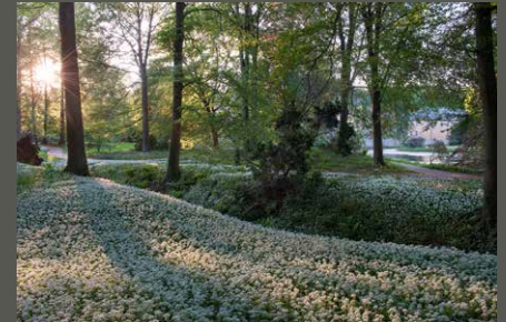
Park Schloss Dyck, Landschaftspark Jüchen Jürgen Becker (2012)