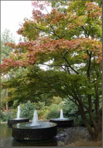
Forstbotanischer Garten, Köln Pohl + Grüßen (2023)