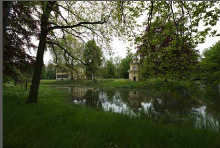
Huis Landfort, Megchelen (NL) Jens Spanjer (2023)