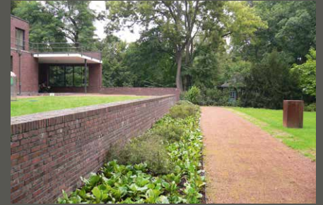
Haus Esters / Haus Lange, Krefeld Pohl + Grüßen (2011)