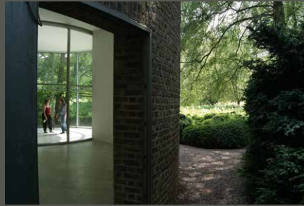
Museum Insel Hombroich, Neuss Pohl + Grüßen (2010)