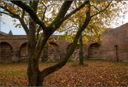
Friedestrompark Zons, Dormagen Stefan Büntig (2023)