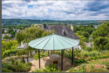
Adenauergarten, Bad Honnef