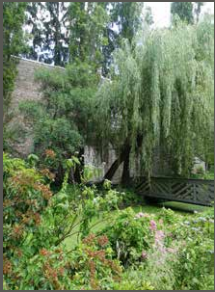
Museum Insel Hombroich, Neuss Pohl + Grüßen (2019)