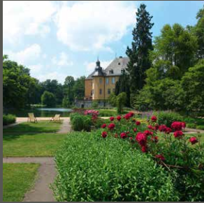
Park Schloss Dyck, Jüchen Pohl + Grüßen (2021)