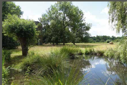
Museum Insel Hombroich, Neuss Pohl + Grüßen (2019)