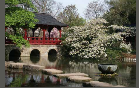
Carl Duisberg Park / Japanischer Garten, Leverkusen