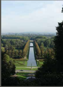
Klevert Gartenlandschaft, Kleve Pohl + Grüßen (2023)