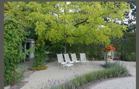
Kasteeltuinen Arcen, Arcen (NL) Pohl + Grüßen (2017)