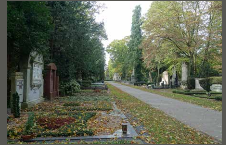
Melatenfriedhof, Köln Pohl + Grüßen (2023)