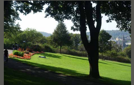
Botanischer Garten Wuppertal, Wuppertal Pohl + Grüßen (2023)