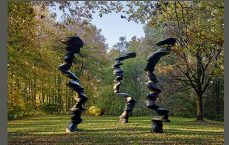
Skulpturenpark Waldfrieden, Points of view (Tony Cragg), Wuppertal Cragg Foundation/ Michael Richter (2022)