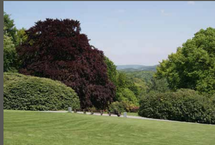
Adolf- Vorwerk-Park, Wuppertal Pohl + Grüßen (2013)