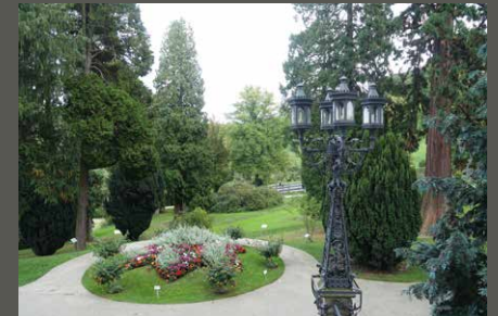
Park Schloss Drachenburg, Königswinter Pohl + Grüßen (2023)