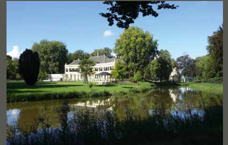
Huis Landfort, Megchelen (NL) Pohl + Grüßen (2022)