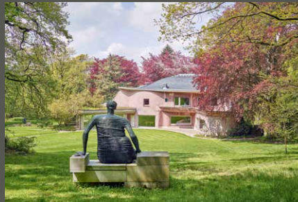
Skulpturenpark Waldfrieden, Sitzende (Henry Moore), Wuppertal Cragg Foundation/ Michael Richter (2023)