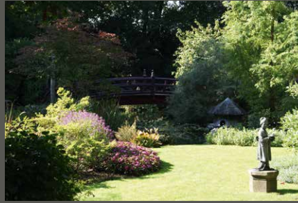
Carl Duisberg Park / Japanischer Garten, Leverkusen Pohl + Grüßen (2010)