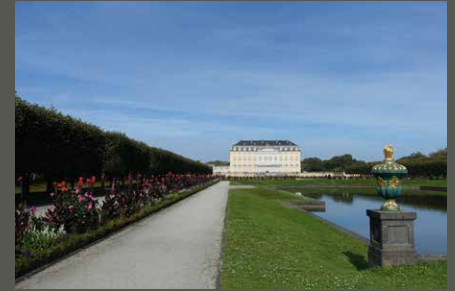
Park Schloss Augustusburg, Brühl Pohl + Grüßen (2023)