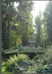
Melatenfriedhof, Köln Pohl + Grüßen (2023)