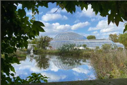
Flora – Botanischer Garten, Köln Nina Just (2023)