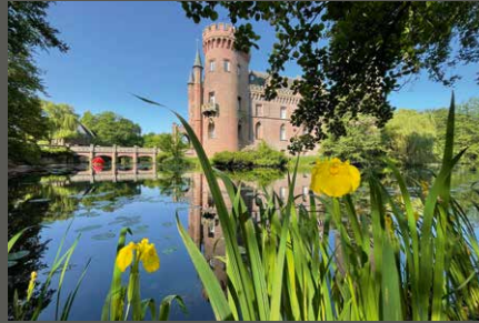
Park Schloss Moyland, Bedburg-Hau Stiftung Museum Schloss Moyland/ Sofia Tuchard (2023)