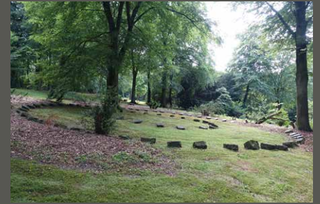
Barmer Anlagen, Wuppertal Pohl + Grüßen (2019)