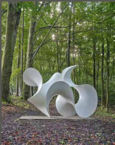
Skulpturenpark Waldfrieden, Wave (Eva Hild), Wuppertal Courtesy of the artist/ Michael Richter (2017)