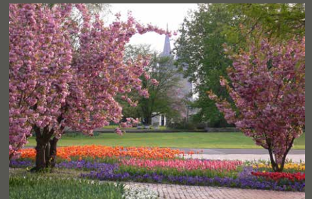
Rheinpark, Köln Pohl + Grüßen (2005)