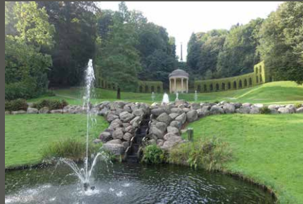
Klever Gartenlandschaft, Kleve Pohl + Grüßen (2023)