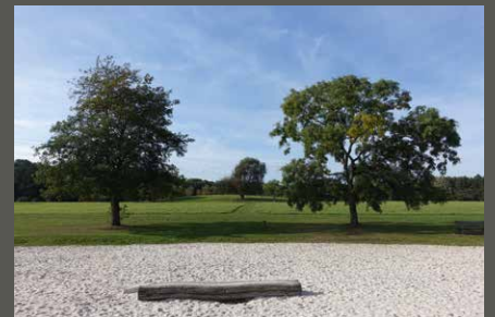
Forstbotanischer Garten, Köln Pohl + Grüßen (2023)