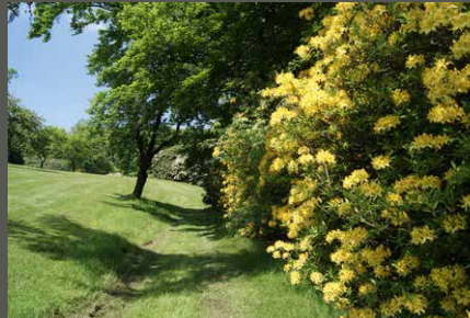
Adolf-Vorwerk-Park, Wuppertal Pohl + Grüßen (2013)