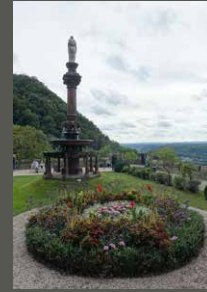
Park Schloss Drachenburg, Königswinter Pohl + Grüßen (2023)