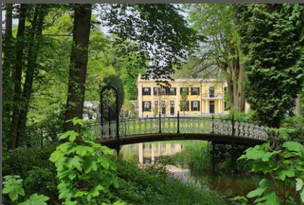
Huis Landfort, Megchelen (NL) Christopher Kreutchen (2023)