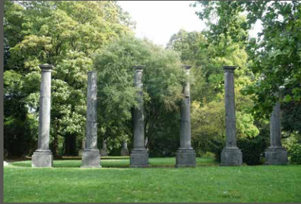
Waldpark Lousberg, Aachen Pohl + Grüßen (2023)