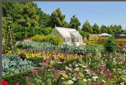
Park Schloss Dyck, Küchengarten Jüchen Stiftung Schloss Dyck/ Jens Spanjer (2021)