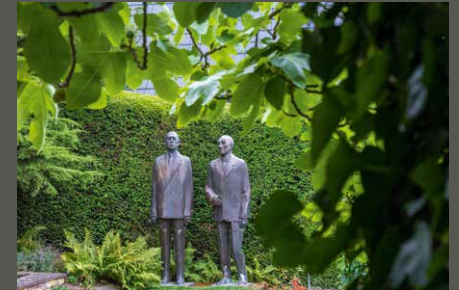
Adenauergarten, Bad Honnef