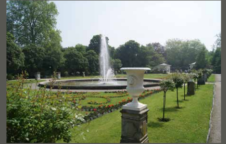
Flora – Botanischer Garten, Köln Pohl + Grüßen (2012)