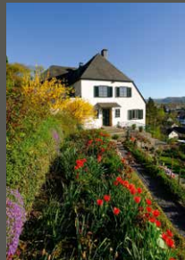
Adenauergarten, Bad Honnef Stiftung Bundeskanzler- Adenauer-Haus/ Frank Homann (2016)