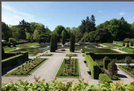
Kasteeltuinen Arcen, Arcen (NL) Pohl + Grüßen (2019)